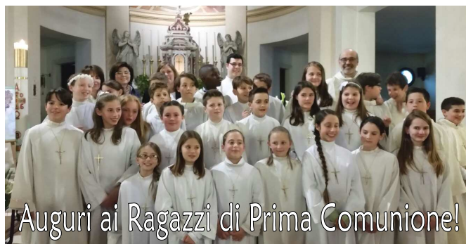
Auguri ai Ragazzi di Prima Comunione!