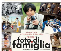
FOTO DI FAMIGLIA