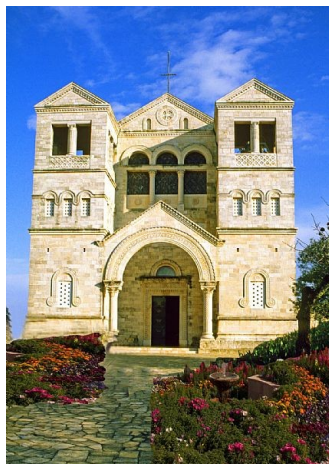
Santuario del Monte Tabor, Galilea

Prendendo la parola, Pietro disse a Gesù: "Signore, è bello per noi essere qui! Se vuoi, farò qui tre capanne, una per te, una per Mosè e una per Elia". Egli stava ancora parlando, quando una nube luminosa li coprì con la sua ombra. Ed ecco una voce dalla nube che diceva: "Questi è il Figlio mio, l'amato: in lui ho posto il mio compiacimento. Ascoltatelo". All'udire ciò, i discepoli caddero con la faccia a terra e furono presi da grande timore. Ma Gesù si avvicinò, li toccò e disse: "Alzatevi e non temete". Alzando gli occhi non videro nessuno, se non Gesù solo. Mentre scendevano dal monte, Gesù ordinò loro: "Non parlate a nessuno di questa visione, prima che il Figlio dell'uomo non sia risorto dai morti".