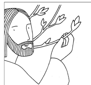
«Dalla pianta di fico imparate la parabola»

Anno 2018 - N. 42 - Domenica 18 Novembre - XXXIII del Tempo Ordinario