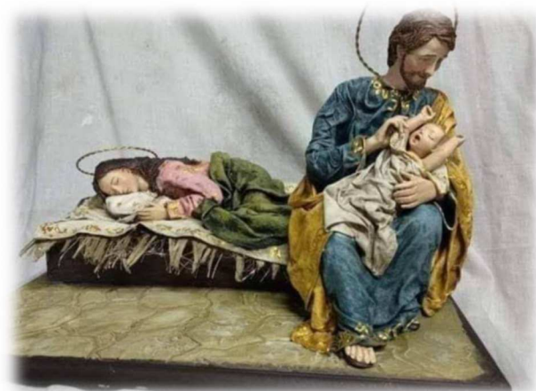
«Facciamo riposare Mamma». Un bellissimo presepe dal Paraguay con Giuseppe che si prende cura di Gesù mentre Maria riposa.